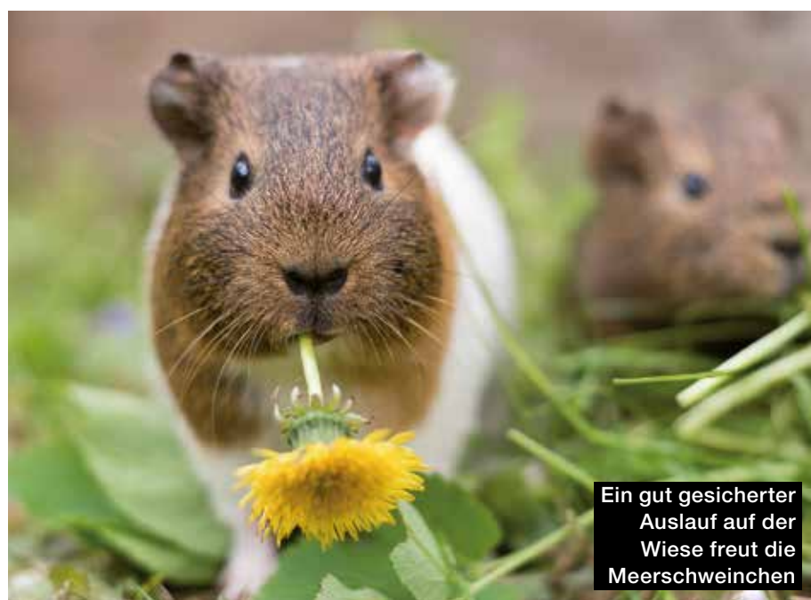
Ein gut gesicherter Auslauf auf der Wiese freut die Meerschweinchen