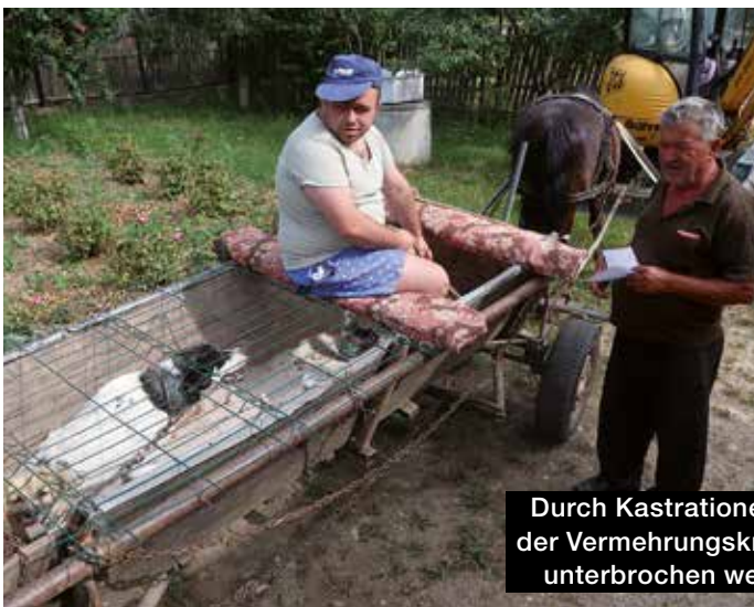
Durch Kastrationen soll der Vermehrungskreislauf unterbrochen werden

Überhaupt ist die politische Gemengelage kompliziert. Wie gut kommt es an, wenn ein Deutscher nach Rumänien fährt und Einheimische über Tierschutz belehrt? Was gilt als Hilfe, was als Einmischung? „Wenn du denkst, du hättest die Weisheit mit Löffeln gefressen, kannst