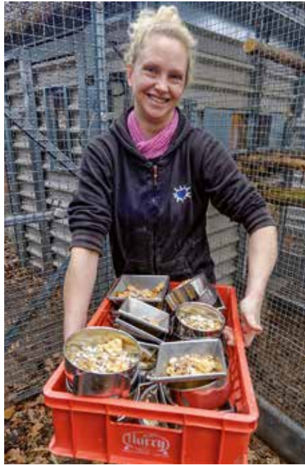
Eine ehrenamtliche Mitarbeiterin hat das Futter für die Tiere vorbereitet

Meist sind die Halter überfordert. Nachbarn haben sich über das Gekrächze der Vögel beschwert, sie machen mehr Arbeit als gedacht oder Oma ist gestorben – wer nimmt jetzt den Papagei? Wenn das Ordnungs- oder Veterinäramt vom Nachbarn informiert oder um Hilfe gebeten wurde und sie den Vogel nach Rädell bringen, kommt der Neuankömmling zunächst in das separate Quarantänegebäude. Nach einer tierärztlichen Untersuchung, die vor allem auf ansteckende Krankheiten und wahrscheinliche Flugunfähigkeit achtet, braucht es Zeit und Geduld, den Papagei wieder aufzupäppeln. Viele der