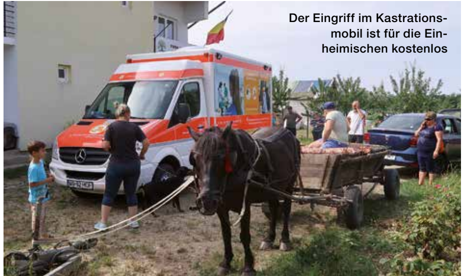
Der Eingriff im Kastrationsmobil ist für die Einheimischen kostenlos

Ein paar Kilometer weiter liegt das Dorf Mălureni. Während in der nahegelegenen Großstadt Pitesti die Menschen über Boulevards flanieren und sich im Multiplex-Kino vergnügen, kommen sie in Mălureni per Pferdefuhrwerk zum Kastrationsmobil. Ein ehrenamtlicher Helfer, der als Bürgermeister kandidiert, stellt seinen Hof zur Verfügung. „Um etwas Gutes für die Gemeinschaft zu tun“, wie er mehrfach betont. Die Mundpropaganda hat gewirkt, es kommen 25 Personen. Manche transportieren ihre Hunde in Käfigen, andere führen sie an rostigen Ketten. Luther, ein American-Staffordshire-Mix, bellt alle an. Genau wie ein Brackemischling, der eher jault als bellt. „Wenn er kastriert ist, wird er ruhiger“, hofft die Besitzerin.