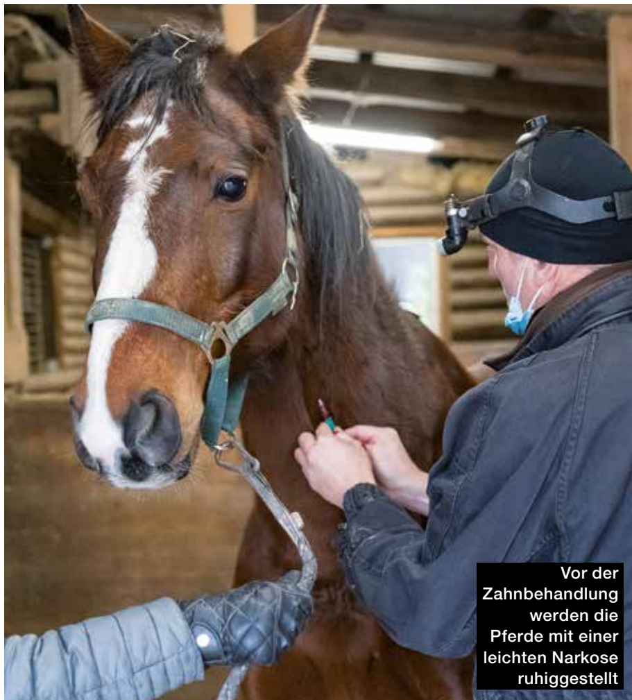
Vor der Zahnbehandlung werden die Pferde mit einer leichten Narkose ruhiggestellt