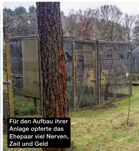
Für den Aufbau ihrer Anlage opferte das Ehepaar viel Nerven, Zeit und Geld