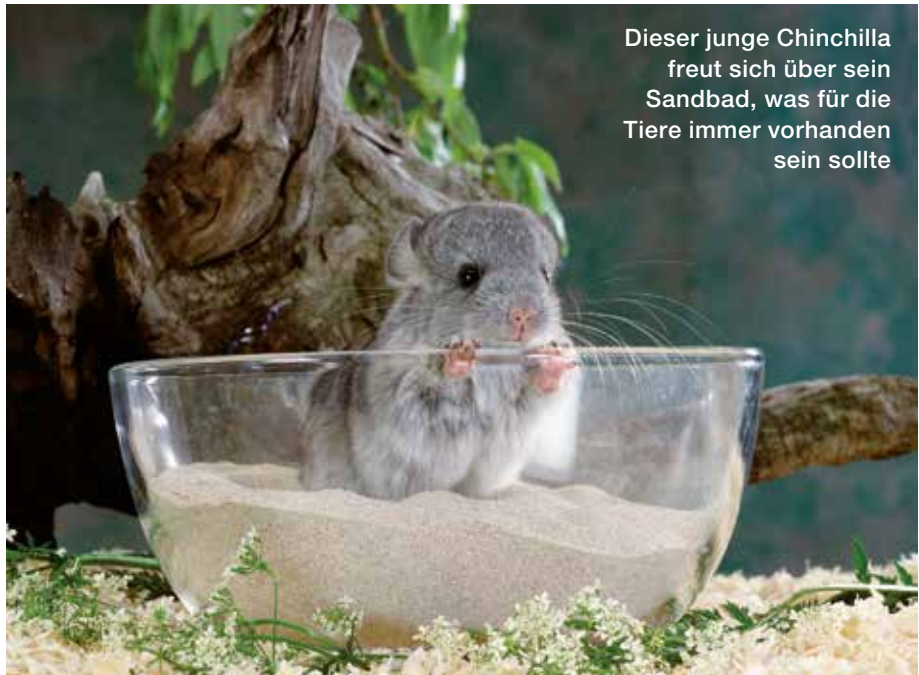
Dieser junge Chinchilla freut sich über sein Sandbad, was für die Tiere immer vorhanden sein sollte

Vorsicht: Chinchillas dürfen auf keinen Fall gebadet werden, denn Nässe ist tödlich für die Tiere! Der nicht wasserabweisende besonders dichte Pelz würde sich mit Wasser vollsaugen und die Tiere infolge stark unterkühlen.