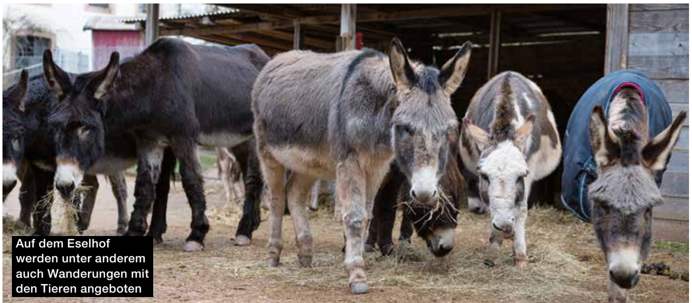
Auf dem Eselhof werden unter anderem auch Wanderungen mit den Tieren angeboten