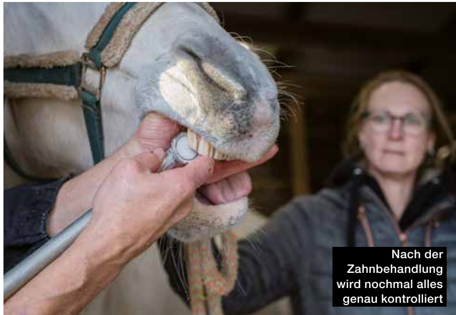
Nach der Zahnbehandlung wird nochmal alles genau kontrolliert

wurde schon mal von einem Hengst am Kopf verletzt, der nach vorne ausgeschlagen hatte, und lag auch mit einer anderen Kopfverletzung schon mal eine Nacht im Krankenhaus. Aber es waren zum Glück keine schweren Verletzungen.