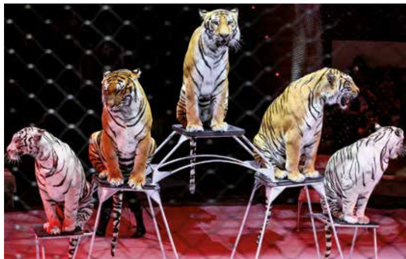
Die Wildtierstation Tierart hat in der Vergangenheit auch immer wieder Tiger aus Zirkussen aufgenommen

Doch es gibt auch Bundesländer, die in dieser Richtung keine Regelung erlassen haben. Das macht es natürlich schwierig, da der Handel mit solchen Tieren weiterhin boomt. Aus Sicht von Vier Pfoten und anderen Tierschutzorganisationen würde es sinnvoll sein, dass man in Deutschland – wie in Belgien und Niederlande – eine sogenannte Positivliste für Haustiere einführt. Das bedeutet, es würden bestimmte