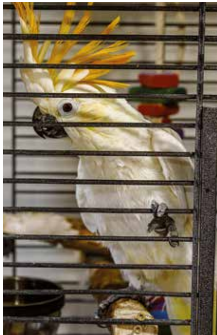
Käufer von Papageien werden oft nicht richtig aufgeklärt

So naiv die Beiden anfangs bei der Anschaffung ihres Grau-Papageis waren, so unbedarft sind noch immer die meisten Käufer von Exoten, die sich auch Schlangen und andere seltene Reptilien in die Wohnung holen. Mittlerweile ist vieles aus Tierschutzgründen verboten, Wildfänge aus Brasilien zum Beispiel und alle Versuche, Exoten über die Grenzen zu schmuggeln. Auch Züchter müssen mittlerweile nachweisen, dass ihre