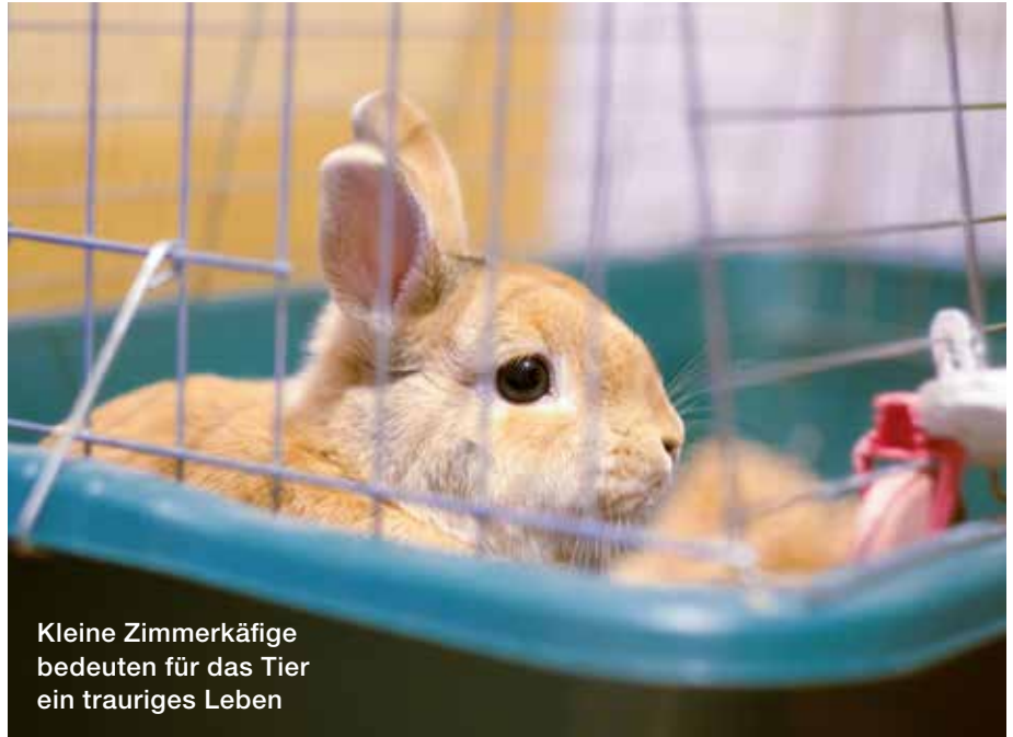
Kleine Zimmerkäfige bedeuten für das Tier ein trauriges Leben

Kaninchen zählen nicht zu den Nagetieren, sondern zu den Hasenartigen (Lagomorpha), da das Zahnschema abweicht. Es existieren zahlreiche wunderschöne Arten von klein (Zwergkaninchen wie z.B. Löwenkopfkäfigchen oder Far-