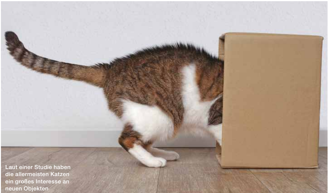
Laut einer Studie haben die allermeisten Katzen ein großes Interesse an neuen Objekten

Der Weg der Medizinstudentin und der Evolutionsbiologin zu ihrem Ergebnis liest sich für mich wie mein zukünftiger Traumberuf. Sie verlegten ihre Untersuchung zwischen August 2021 und Juni 2022 in ein Katzencafé und beobachteten die Vierbeiner. Von den 276 Gesichtsausdrücken der ausgewachsenen Kurzhaarkatzen seien 45,7 Prozent als positiv und 37 Prozent als negativ iden-