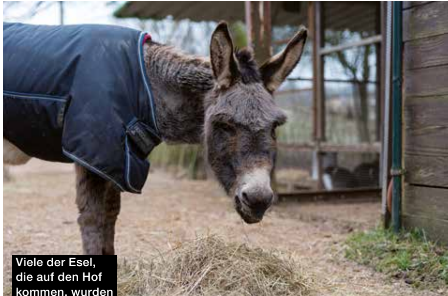
Viele der Esel, die auf den Hof kommen, wurden vorher nicht gut behandelt

Weitere Information unter: www.eselzentrum-neumuehle.de