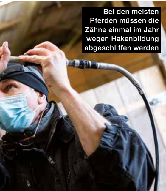
Bei den meisten Pferden müssen die Zähne einmal im Jahr wegen Hakenbildung abgeschliffen werden