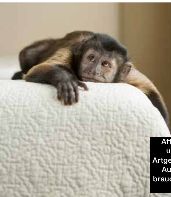
Affen sind sozial und brauchen Artgenossen. Rechts: Auch Schlangen brauchen die richtige Umgebung