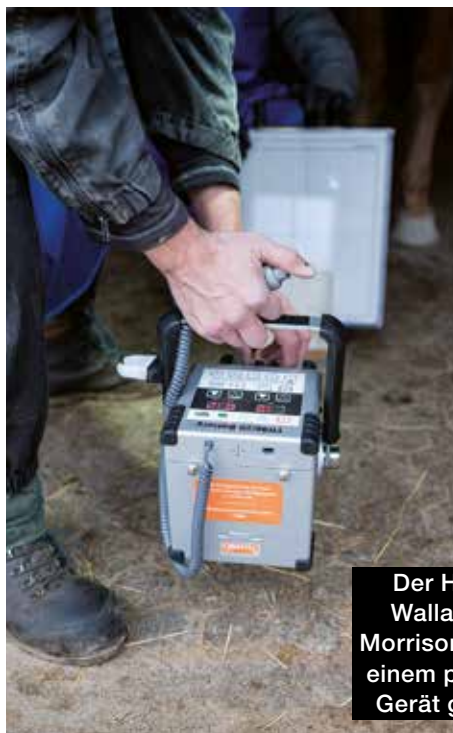
Der Huf von Wallach Van Morrison wird mit einem portablen Gerät geröntgt