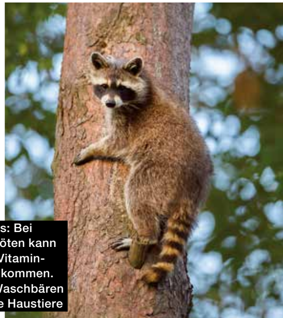
Links: Bei Schildkröten kann es zu Vitaminmangel kommen. Rechts: Waschbären sind keine Haustiere