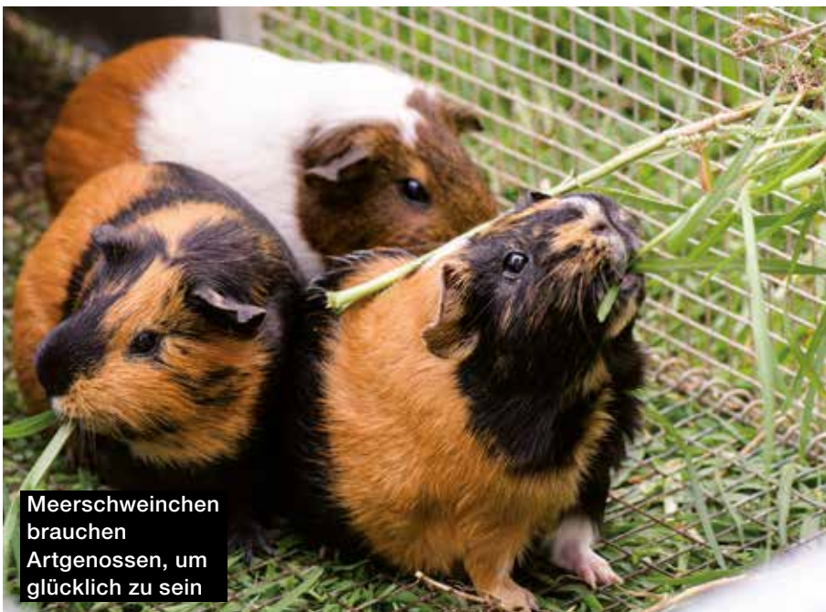
Meerschweinchen brauchen Artgenossen, um glücklich zu sein

Die Tierärztliche Vereinigung für Tierschutz (TVT) empfiehlt eine Mindestfläche von 2 m 2 Grundfläche für zwei bis vier Meerschweinchen (jedes weitere + 0,5 m 2 ). Besonders lustig an-